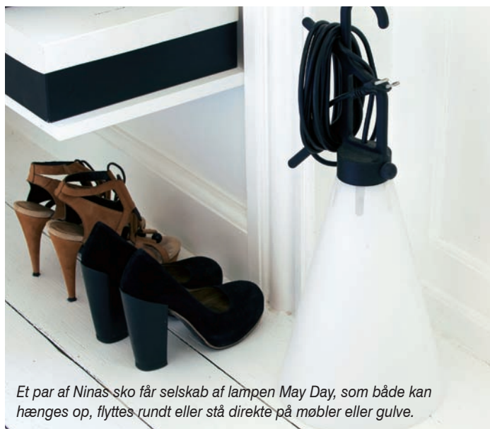
Et par af Ninas sko får selskab af lampen May Day, som både kan hænges op, flyttes rundt eller stå direkte på møbler eller gulve.

”Når man flytter ind i en lejlighed, vil man hellere have et gammelt køkken end et nyt, der er grimt, som man så ikke kan lide at skifte ud, fordi det er nyt”