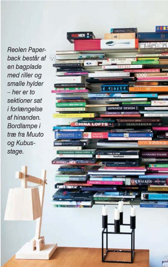
Reolen Paperback består af en bagplade med riller og smalle hylder – her er to sektioner sat i forlængelse af hinanden. Bordlampe i træ fra Muuto og Kubus-stage.