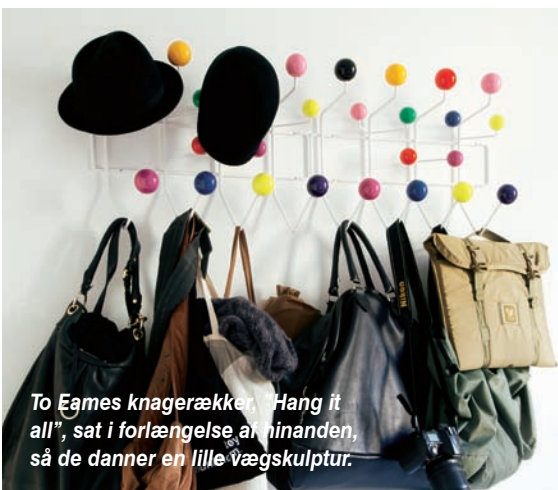
To Eames knagerækker "Hang it all", sat i forlængelse af hinanden, så de danner en lille vægskulptur.