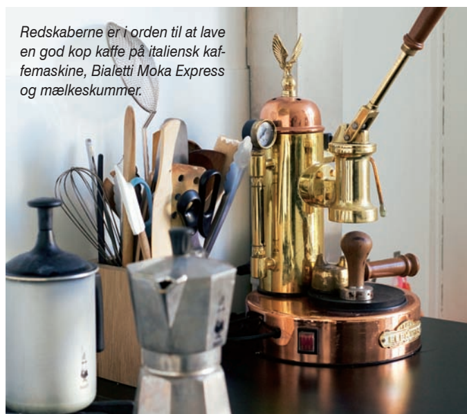
Redskaberne er i orden til at lave en god kop kaffe på italiensk kaffemaskine, Bialetti Moka Express og mælkeskummer.