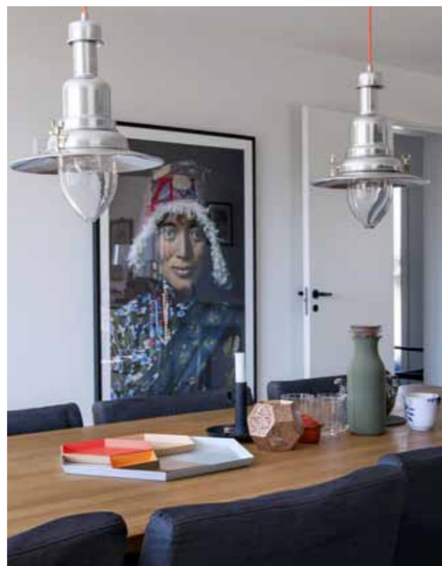
ALRUM Billedet på væggen er et forstørret foto af fotografen Steve McCurry. Bakkerne på bordet er fra Hay. Lamperne er fra Ikea, ledningerne er skiftet ud med neonfarvede stofledninger.

Og på to år har de med families, venners og håndværkeres hjælp renoveret det hele. Nye gulve, nyt køkken, nye badeværelser, hver en centimeter er fornyet, og stemningen er blevet lys og præget af liv og farveglæde. I murstensbygningen er der kommet arbejds- og showroom med køkken og i hallerne lagerplads. Alt sammen gjort med gode, billige løsninger for øje.