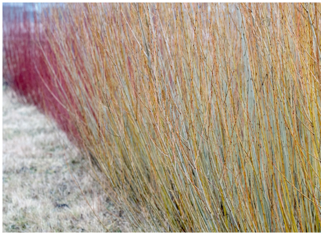
Salix Belle Isle, Fransk flødefarvet, med flødefarvede grene med sorte knopper. En almindelig flettepil i Frankrig og den eneste, der dyrkes i Belle Isle, som den er opkaldt efter. Smidig og god til alle former for flet.