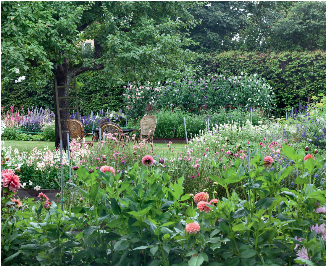
Et kig ud over skærehaven med dahlia, forskellige kornblomster, løvemund, dusksalvie, sommerridderspore, kongekommen, dild og solsikke. Langs hækken står lathyrus, sommerflok og digitalis.