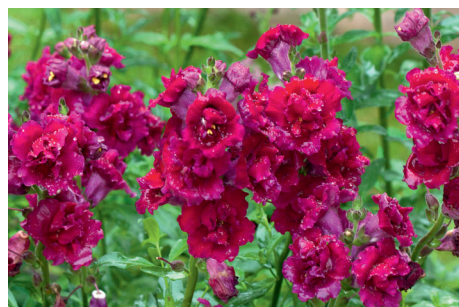
Løvemund, Antirrhinum majus "Double Madame Butterfly" med fyldte blomster. Enårig, som blomstrer til frost. Forspires i jan-marts og plantes ud midt i maj. Trives i fuld sol.