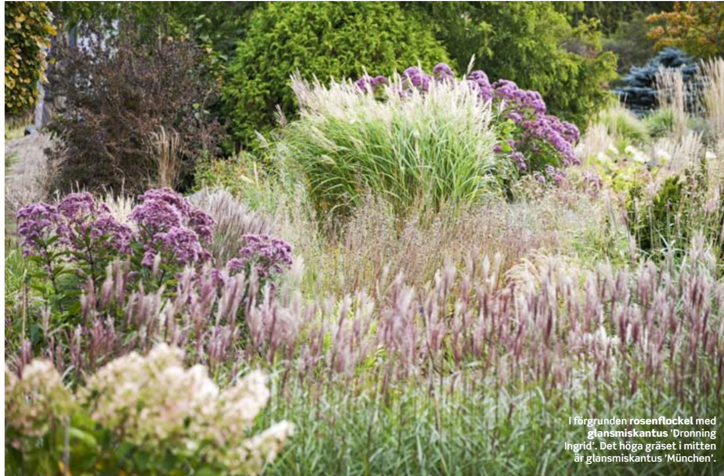
I förgrunden rosenflockel med glansmiskantus 'Dronning Ingrid'. Det höga gräset i mitten är glansmiskantus 'München'.