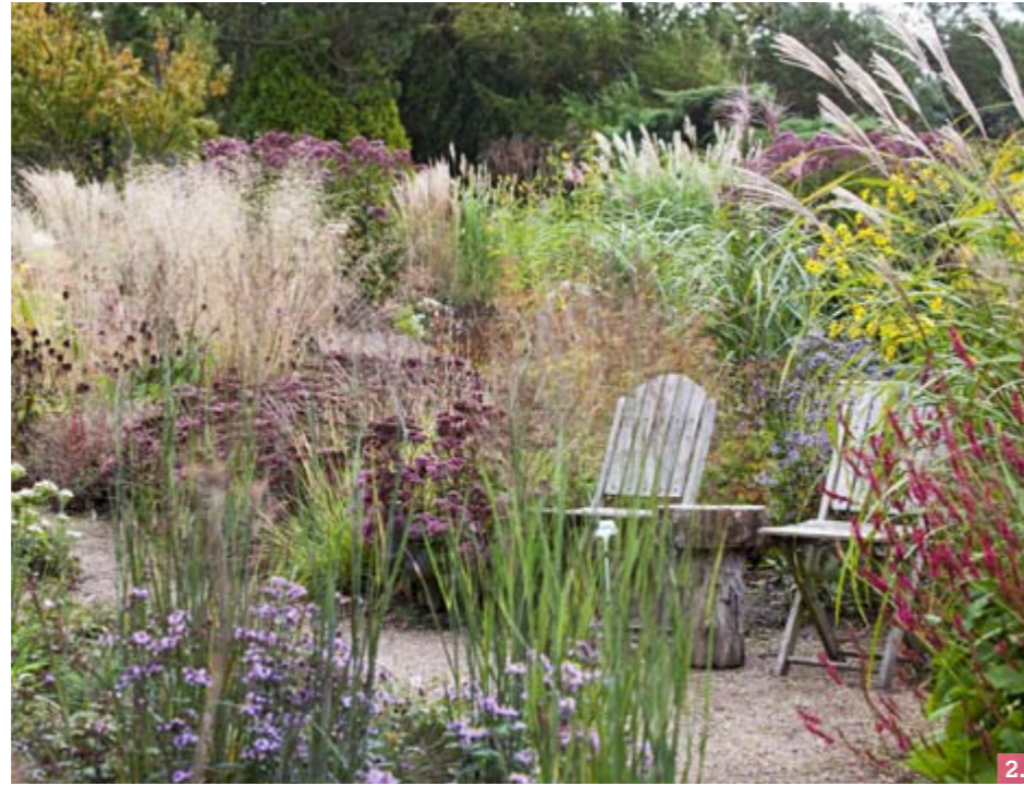
1. Tuvtåtel mellan tistelbollar och rosenflockel. 2. I Overdams Plantskola finns idéer till olika kombinationer av gräs och perenner.

En blåsig höstdag med sol och moln är perfekt väder för att uppleva den mångfald som finns hos gräsen i Overdams Plantskola på Själland i Danmark. Det är en berusande och känslomässig upplevelse att vandra omkring bland tusentals böljande gräs.