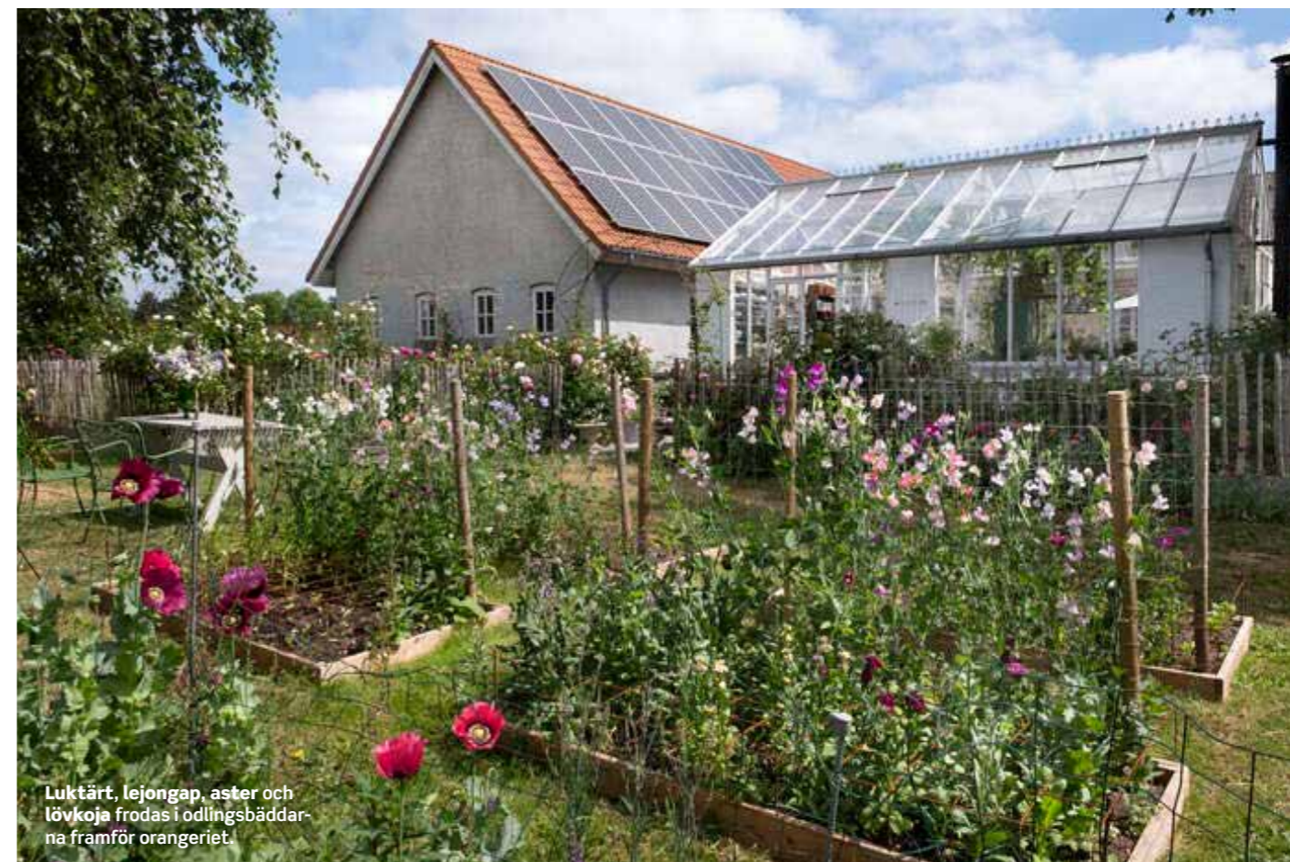
Luktärt, lejongap, aster och lövkoja frodas i odlingsbäddarna framför orangeriet.

”Jag börjar så inomhus i februari. Lite senare använder jag även orangeriet och växthuset, även om det inte är uppvärmt där. Det blir tusentals plantor, så jag behöver all yta jag kan få.”