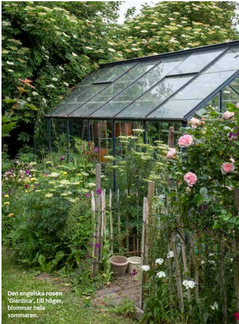
Den engelska rosen 'Giardina', till höger, blommar hela sommaren.