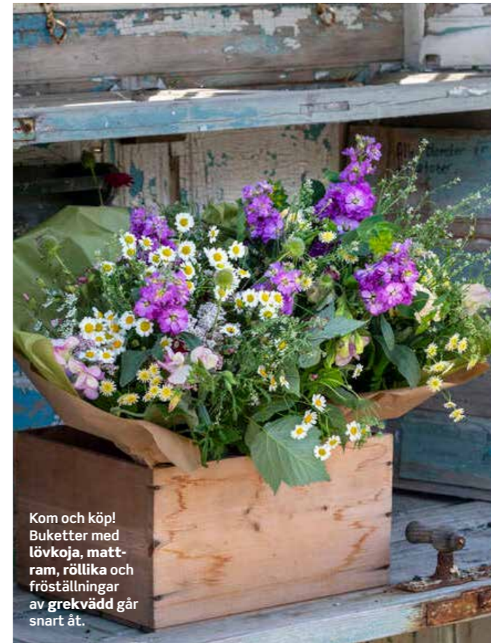
Kom och köp! Buketter med lövkoja, matt-ram, röllika och fröställningar av grekvädd går snart åt.