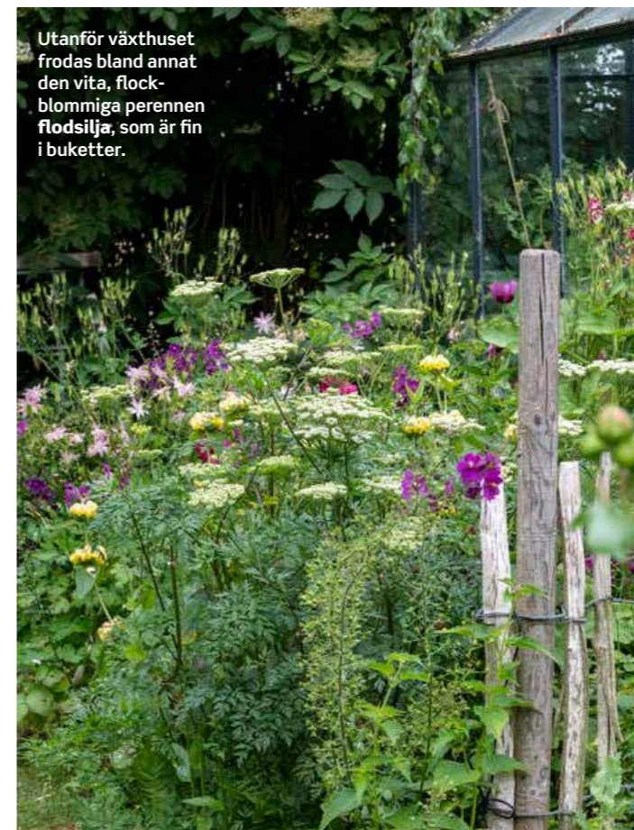
Utanför växthuset frodas bland annat den vita, flockblommiga perennen flodsilja, som är fin i buketter.