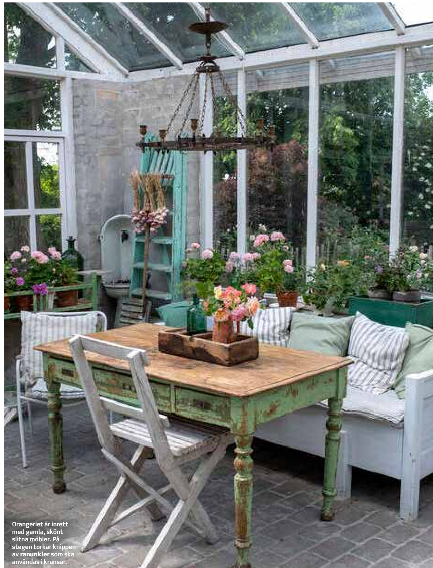
Orangeriet är inrett med gamla, skönt slitna möbler. På stegen torkar knippen av ranunkler som ska användas i kransar.