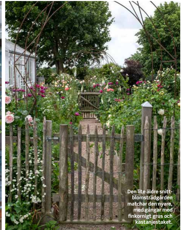
Den lite äldre snittblomsträdgården matchar den nyare, med gångar med finkornigt grus och kastanjestaket.