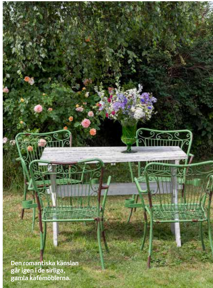
Den romantiska känslan går igen i de sirliga, gamla kafémöblerna.